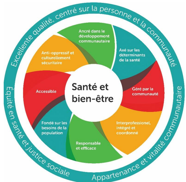
Figure 5 : Modèle de santé et de bien-être

Une méthode d'engagement communautaire qui assure une participation et une autonomisation efficace des représentants des communautés locales dans la planification, l'établissement des orientations et le suivi des organismes de santé afin de répondre aux besoins et aux priorités en matière de santé et de bien-être des populations au sein des quartiers communautaires locaux. Les membres de l'Alliance sont des organismes sans but lucratif, régis par des conseils d'administration (CA) communautaires constitués de membres de la communauté locale. Les CA et les comités communautaires fournissent aux centres un mécanisme pour représenter les besoins de leurs communautés locales et y répondre, et pour que les collectivités cultivent une prise en charge démocratique de « leurs » centres. La gouvernance communautaire contribue à la santé des communautés locales en participant activement au capital social et au leadership communautaire.