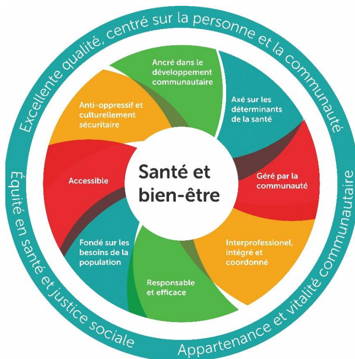
Figure 1 : Modèle de santé et de bien-être

Le secteur de soins de santé communautaire de première ligne a élaboré ce modèle fondé sur des données probantes pour décrire et orienter la prestation des soins de santé primaires (Rayner et coll., 2018). Le modèle définit la santé de la même manière que l'Organisation mondiale de la santé (OMS),